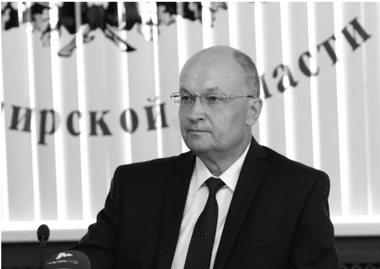
На июньском заседании Законодательного Собрании было принято сразу несколько законов, призванных защитить покой добропорядочных граждан.

На практике действие закона будет выглядеть так: полицейские как выезжали, так и продолжают выезжать на место, гото-